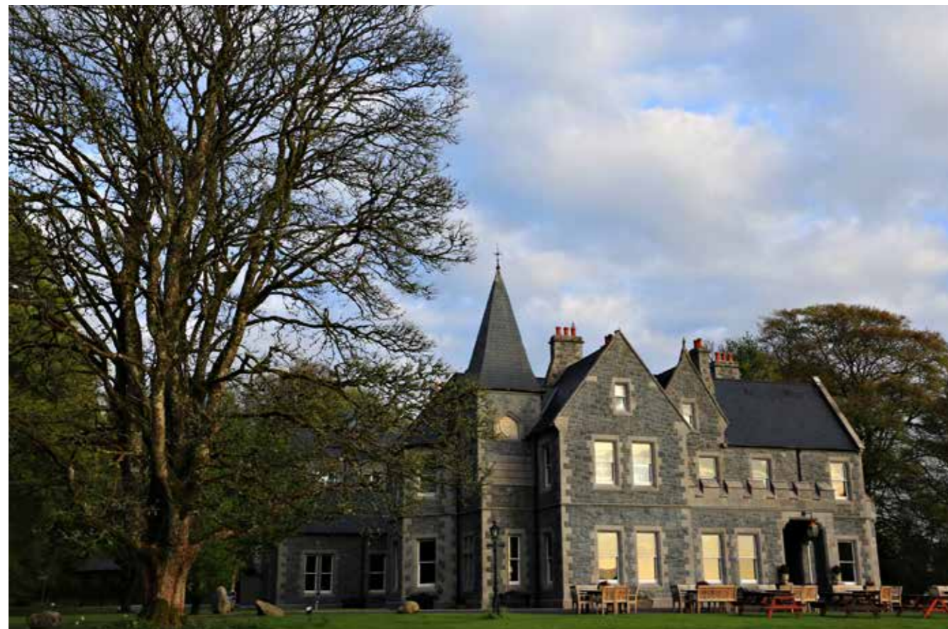
1. Mount Falcon Estate ved Ballina er et herskaps hus opprinnelig bygget i 1872 som en kjærlighetserklæring. Eierne i dag har restaurert og oppgradert bygget siden 2002.